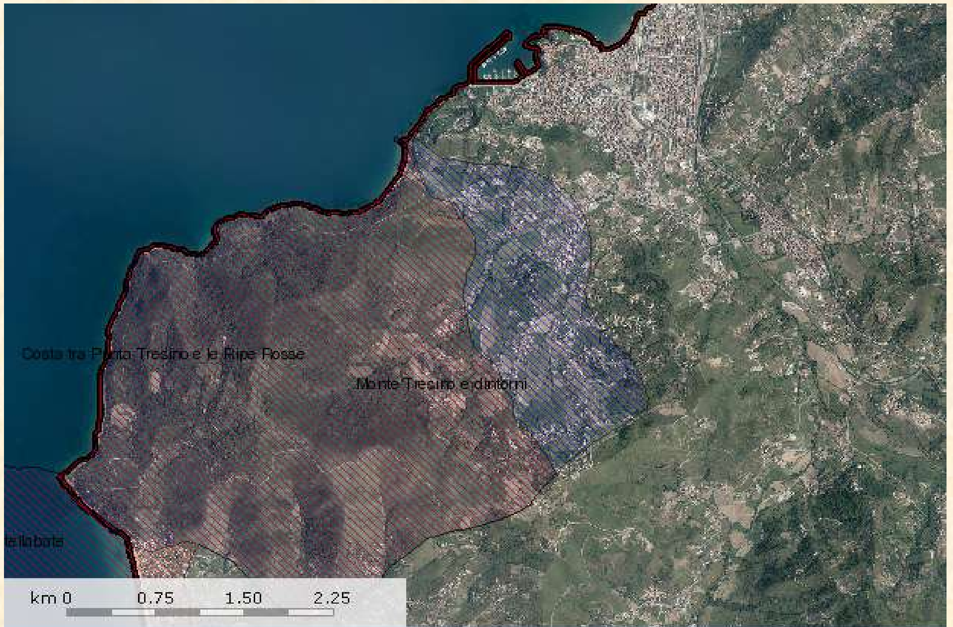
SIC e ZPS interessanti il Comune di Agropoli